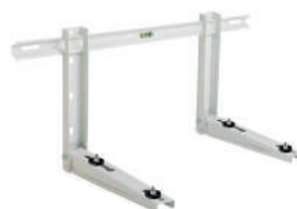
WBS Qpluss Muurbeugel WBS Qpluss Support mural 800 x 550 mm - 160 kg