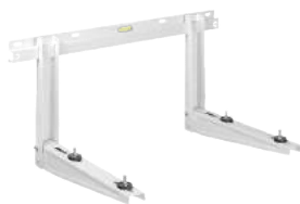
MS257 Rodigas muurbeugel MS257 Rodigas Support mural 800 x 550 mm - 140 kg