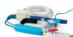
Aspen Mini-Aqua Silent+